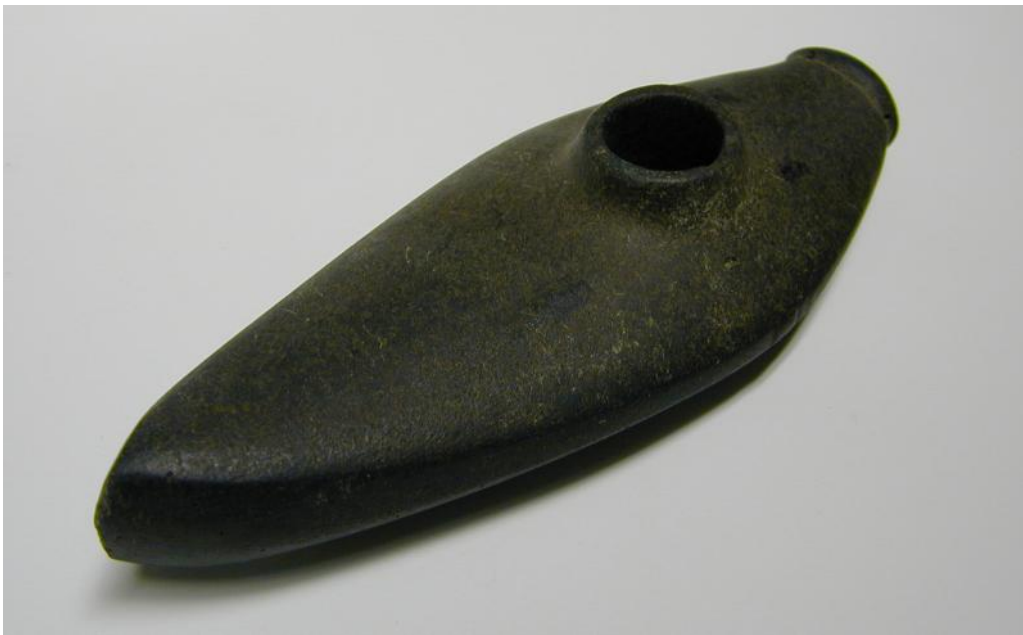
Stridsyx, av svensk-norsk typ.