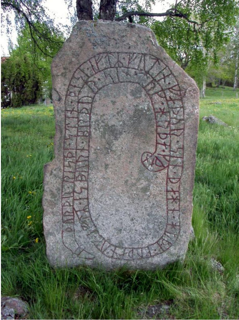
Runstenen i Fröstorp, Hovs socken.

Skrivandet med runor förekom i Norden redan i slutet av 100-talet men skrivtecknen var hämtade från trakten kring Donau eller ett stycke in i romarriket där en del av goterna och besläktade stammar befann sig. Enstaka runtexter på små stenar eller vapen är kända från de efterföljande seklerna men det var först i början av 1000-talet som traditionen slog igenom att resa runstenar, varefter den ebbade ut efter ett par generationer. Både stenarnas form, ristningsstilen i sig och texternas utformning är hämtade från en gemensam mall, som