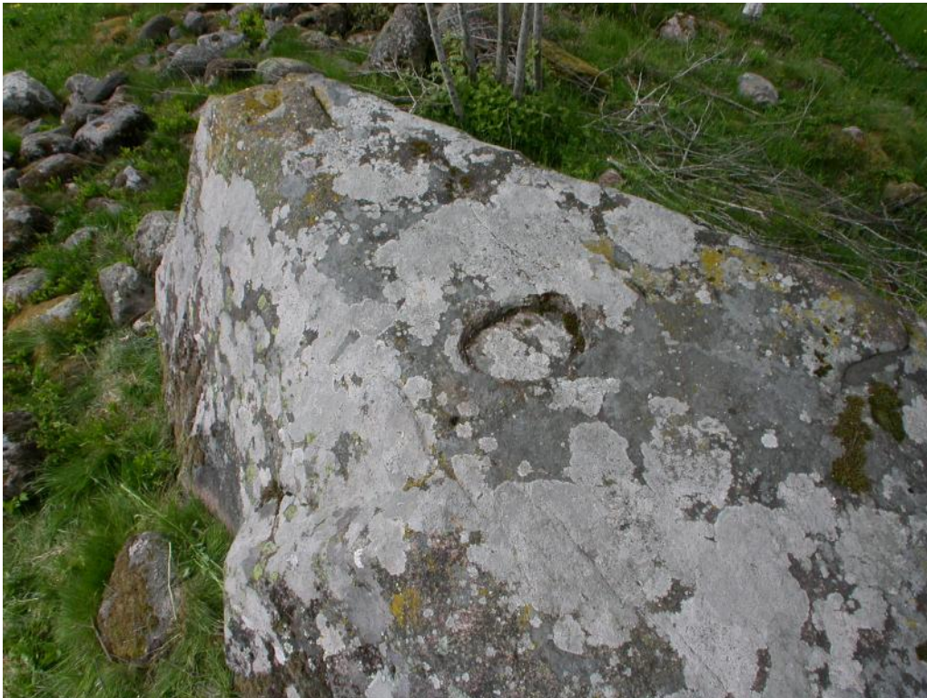
Stenblock med skålgropar samt en säregen rund fördjupning c:a 25 cm i diameter, Ods socken.

inte på något sätt påminner om hållristningarna. Enstaka fynd vittnar om att runstenarna från början var målade över hela ytan i svart, vitt och rött, men också gult och andra färger kan ha använts. Texten berättar ofta om en eller flera personer som låtit resa den berörda stenen till minne av någon nära släkting som avlidit. Ibland finns en avslutande text som visar att de var kristna, att de byggt en bro eller avslöjar namnet på den person som färdigställde runstenen. Ofta tolkas texten som ett arvsdokument där den eller de som lät resa runstenen ärvde de som nämns som avlidna.