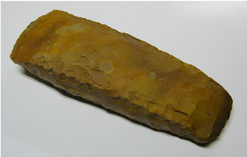
En av många välhuggna flintyxor, som dock aldrig blev slipad, från den första årtusendet av bönder i Norden.

da eller högst några få ställen och fördes sedan ut till alla andra delar av södra Skandinavien. De gränser vi finner för denna spridning är nästan alltid likadana, sekel för sekel. Böndernas samhälle tycks ha varit organiserat på ett helt annat sätt än hos jägarstammarna. De levde och bodde i familjer som räknade släktskap efter bestämda regler. Dessa släkter eller ätter bodde ofta men inte alltid i en och samma bygd, där de bedrev boskapsskötsel med andra familjer som ofta tillhörde andra ätter. Bygderna kan ha varit avgränsade från varandra i skilda stammar av juridiska eller religiösa skäl för att underlätta rättsväsendet och offrandet till gudarna. Folkstammarna, eller föregångaren till våra landskap, var förenade med varandra kulturellt sett i enorma områden som under bondestenåldern och bronsåldern ofta täckte hela södra Skandinavien.