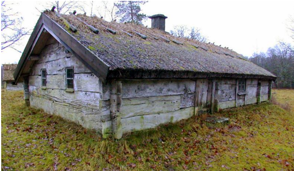
Ryggåsstuga i Skölvene, byggd på 1700-talet.

mirakelberättelse från 1400-talets början kan vi läsa om en moder som var full av glädje över att hennes barn inte hade frusit ihjäl när hon var ute på ägorna och vid hemkomsten upptäckte att den lille hade krupit upp på täcket. Så kallt var det normalt i husen om vintern på den tiden. Den största förändringen som tillgången till ved i stället för ris medförde är kanske inte temperaturen inomhus under vintern, utan möjligheten att äta varm mat mer eller mindre varje dag.