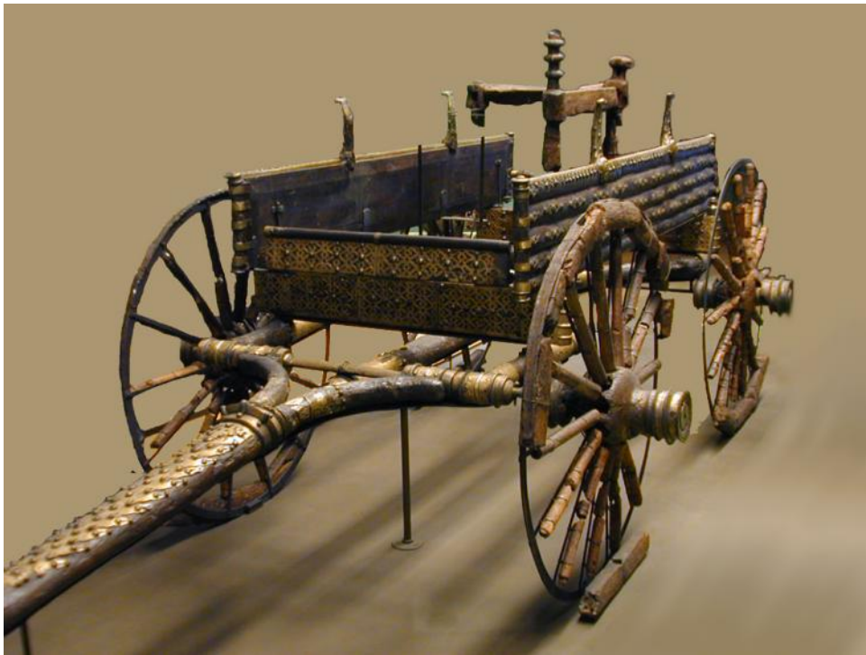
Kultvagn från Dejbjerg i Danmark, numera på Nationalmuseet i Köpenhamn.

tas ut när man så önskade. Under slutet av dolkkulturen ebbade detta ut och gravrummen blev allt mer slutna.