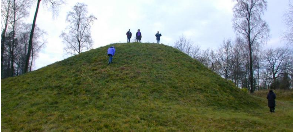
Kungshögen i Larv.

Under 300-talet infördes en ny typ, storhögarna eller kungshögarna. De påminner mycket om bronsålderns runda högar men är i regel större och har inte den kupade och välvda formen som var vanlig under bronsåldern. I stället har de ofta rakt slutande sidor upp mot toppen, sett i profil från marken, samt en plan ovansida så att de grovt sett får tre sidor bortsett från bottenplan, till skillnad från bronsålderns högar som har en jämnare krökning och mer liknar en del av en cirkel sett från sidan.