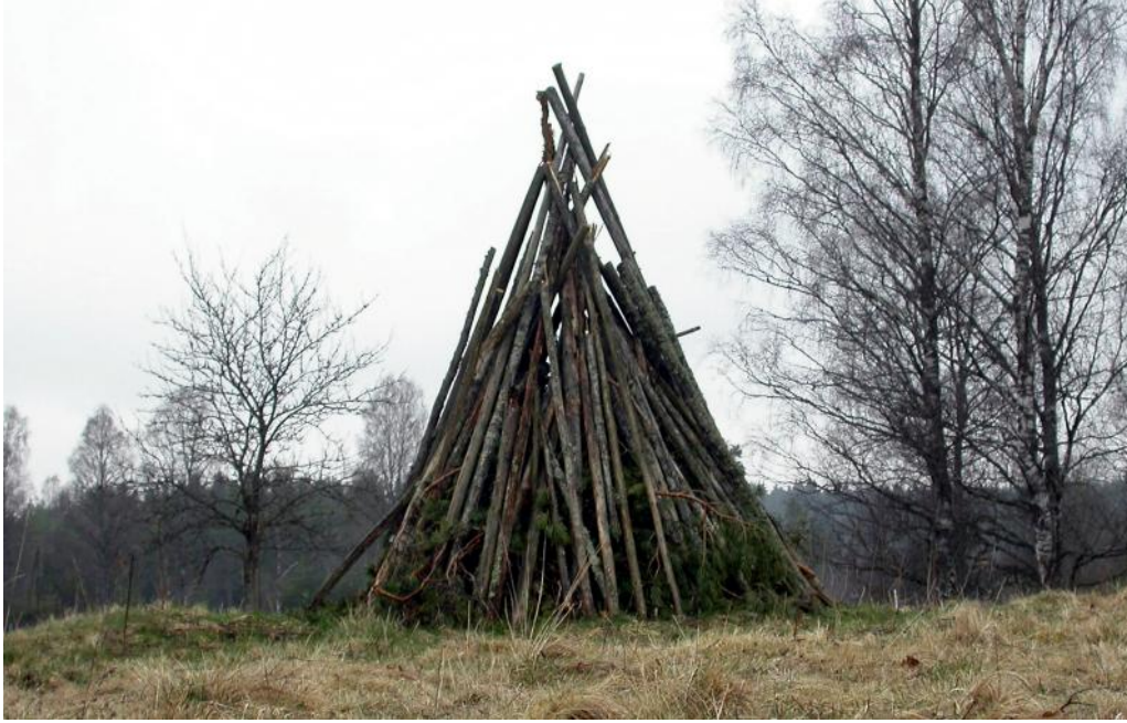
Rekonstruktion av en vårdkase.