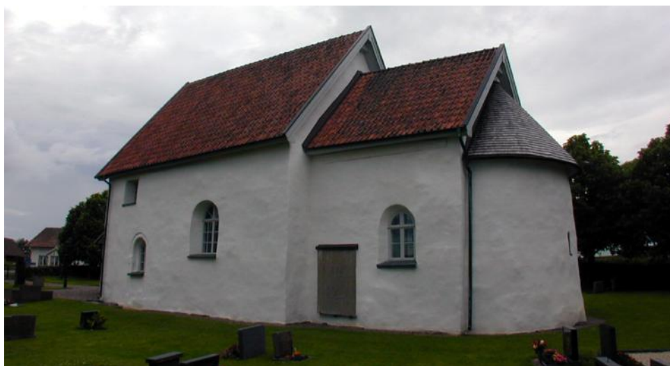
Mjälldrunga medeltida kyrka.

Vid ett av de fem gravfälten i Jällby står tre resta stenar på rad och de kallas Odens flisor. Liknande triader av resta stenar finns på andra håll i södra Sverige och en av de närmaste återfinns i Hudene socken strax västerut. Numera är det ingen längre som vet varför denna typ av fornlämningar alltid är tre till antalet eller varför de heter Odens flisor eller Odens hästar.