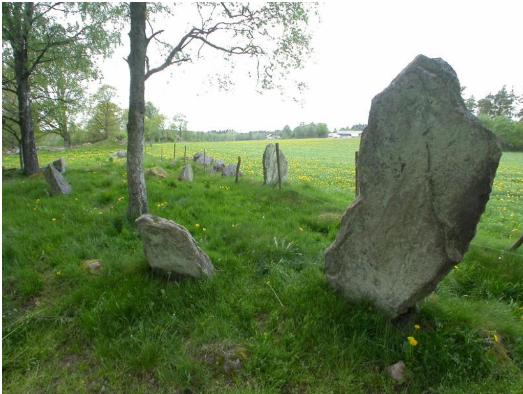
Gravfält vid Fröstorp, Hovs socken.