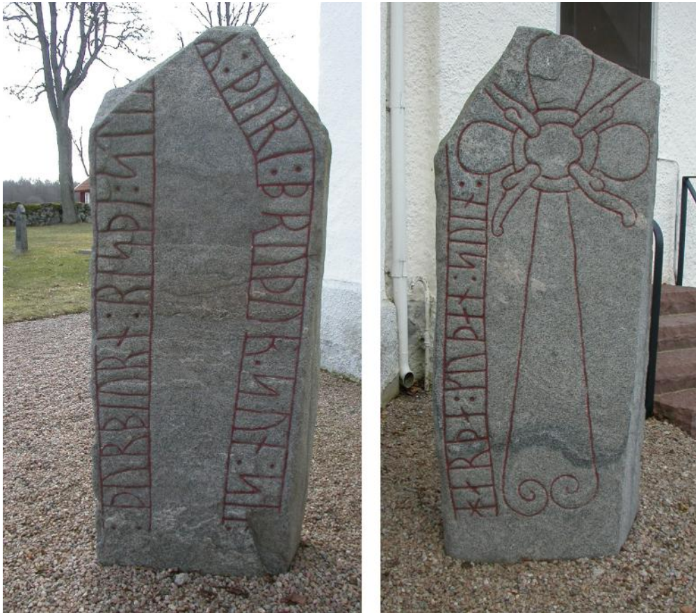
Runstenen vid Remmene kyrka har ristningar på båda sidorna.

Runstenarna från Herrljunga kommun är bara sju till antalet varav alla utom en har text bevarad där namnen på de berörda finns med. Totalt berörs 13 personer men ett av namnen saknas i dag. Två av stenarna har rests av den avlidnes hustru, medan de övriga rests av fäder, farbröder, bröder och söner. De avlidna har i samtliga fall haft ett ämbete eller en tjänst som tägn, dräng eller sven. Exakt vad det innebar vet vi inte men i första hand tycks de ha haft administrativa uppgifter på ett gods eller för hela godsinnehav, men de kan också ha varit ledare och organisatörer i en bygd. Tjänsten som tägn har knappast medfört något militärt ansvar, men däremot kan både en dräng och sven ha berörts av ledungsflottan eller andra krigståg.