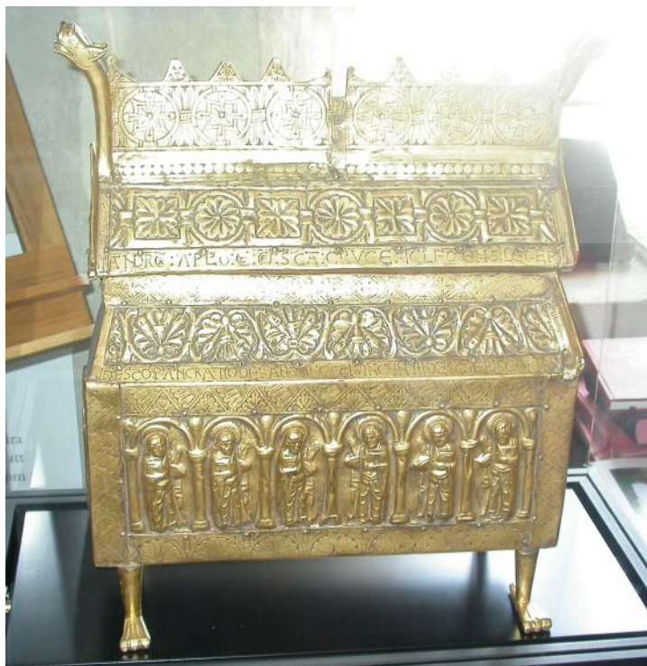
En kopia av det medeltida relikvial som kommer från Eriksbergs kyrka.

1080-talet och de två yngsta daterade stockarna är fällda före mitten av 1120-talet. Långhusets dateringar är samlade i två grupper. Två stockar är från 1080-talet medan fyra stockar anses vara fällda i början av 1150-talet. Hur detta ska tolkas är oklart. En möjlighet är att kor och absid var det första som byggdes i sten runt 1080-talet medan resten uppfördes i trä, samt att man senast på 1150-talet byggde om långhuset och lät bygga även denna del av sten.