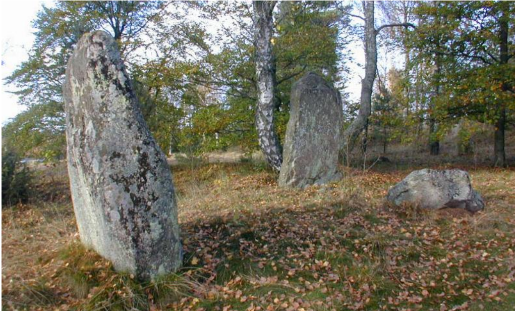
Några av de resta stenarna vid Nycklabacken i Fölene socken.

ningar. Därtill brukar det ibland finnas någon enstaka rest sten, domarring eller skeppssättning. Denna typ av gravfält anlades från 500-talet och ända fram till järnålderns slut och kristendomens införande.