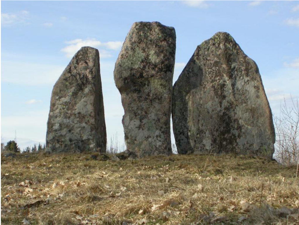
Odens flisor i Hudene socken.

De tre stenarna kallas kort och gott för Odens flisor men ingen kan berätta något mer om dem.