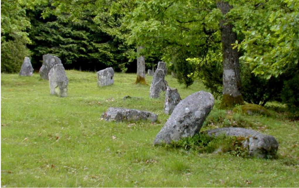
En del av de resta stenar som ingår i Brudföljet i Annelund, Hovs socken.