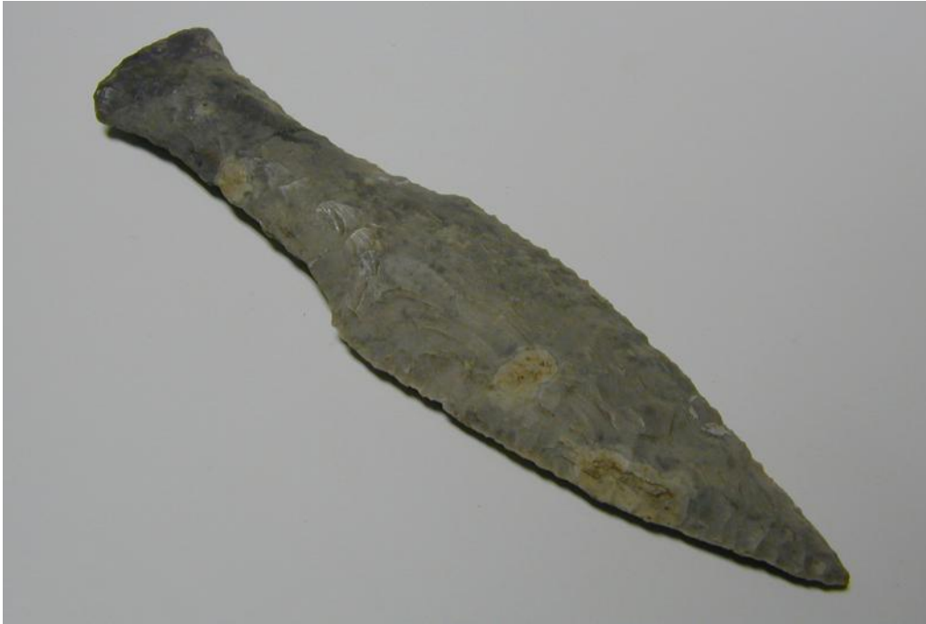
Flintdolk från bondestenålderns slutskede.

Mer än 50 flintdolkar och över 20 flintskärar kommer från 19 av kommunens 22 sockar, men fler dolkar och skärar av flinta kan ha hittats i sen tid och finnas kvar på gårdarna, så dessa uppgifter kan mycket väl öka i framtiden.