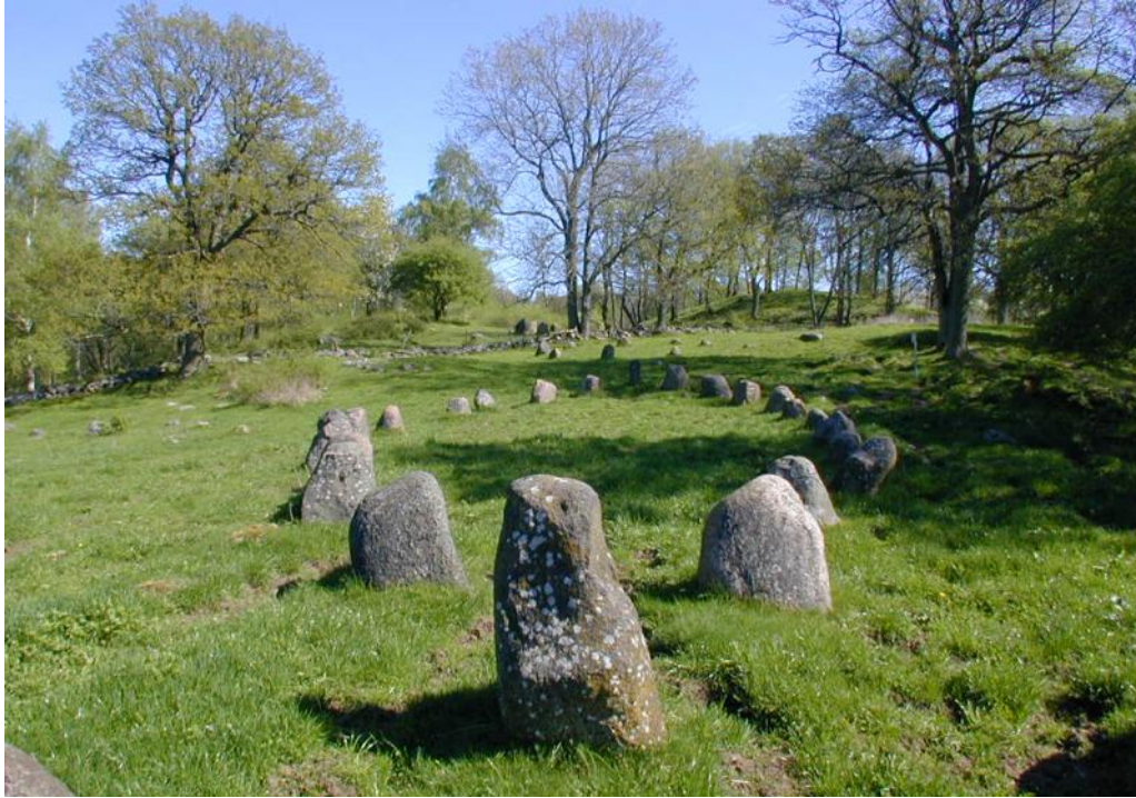
Skeppssättning i Amundtorp vid Hornborgasjön.

ra resta stenar men det finns också en tidig variant som består av små liggande stenar. Domarringarnas och de resta stenarnas föregångare hittar vi på de brittiska öarna där de förekom under lång tid ända fram till bronsålderns slut då de introducerades i västra Sverige för att sedan spridas vidare i Norden.