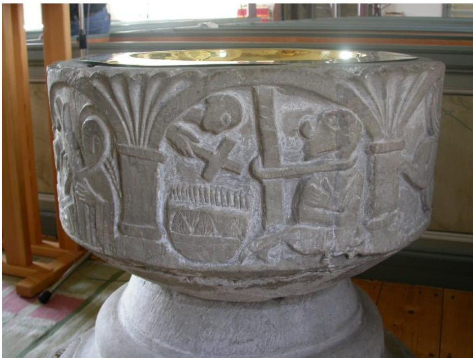
Dopfunten i Skölvene med sina säregna motiv från tidig kristen tid.

Våra medeltida kyrkor är i regel inte övergivna och lagda i ruiner varför de inte räknas bland fornlämningarna, men till ålder och värde för att förstå forna tider är de viktiga. Byggnadsverken i sig är förhållandevis enkla men noga genomtänkta, både vad gäller byggnadsplats som hantverket bakom murverk och takstolar. Ofta har de som byggdes runt 1100-talet både långhus och kor samt emellanåt också absid eller västtorn.