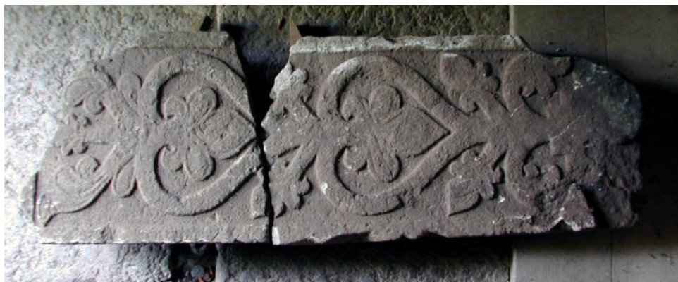
Liljesten i Eriksberg.

Någonstans i socken dog kung Knut Eriksson år 1195 eller 1196 och fördes sedan till Varnhems klosterkyrka där han gravlades i högkoret. Han var son till Erik den helige som förmodligen aldrig besökte Eriksberg, utan snarare ska ses som en upplänning i likhet med flera andra familjemedlemmar. Därifrån for han på korståg till Finland och slutade sina dagar i staden Uppsala. Varför sonen Knut Eriksson dog i Eriksberg får vi kanske aldrig reda på, inte heller varför byn heter just Eriksberg. Att det inte var en tillfällighet att han var här vid sitt frånfälle kan vi dock våga påstå, eftersom biskop Bengt den gode i Skara skänkte kyrkklockorna till kyrkan, vilket var en mycket ovanlig handling som bara berörda särskilda orter. Dessutom finns ett relik-skrin från Eriksbergs som tillsammans med ett nästan likadant från grannsocken Jäla vittnar om att viktiga personer bott i dessa trakter. Bland de exklusiva relikerna fanns bland annat en liten träbit från Jesu kors, om vi får tro på relikskrinets text. Ute vid kyrkogårdsmuren till ett fragment av en stavkorshäll och i samband med markarbeten vid vapenhuset kom nyligen en liljesten i dagen.